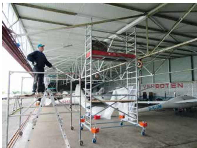
Blick in den Hangar des LSC Wuppertal e. V. während der Sanierungsarbeiten