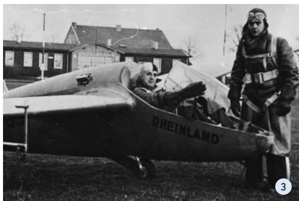
3: Felix Kracht in der FVA-10b „Rheinland“ (1937)