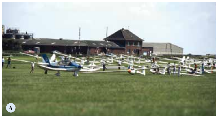
4: Landesmeisterschaften in Aachen-Merzbrück (1985)