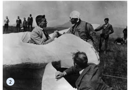
1: Der „Schwatz Düvel“ bei Überholungsarbeiten in der Werkstatt, dahinter die FVA-2 „Blaue Maus“ 2: Anthony Fokker gratuliert Wolfgang Klemperer zu seinem Weltrekord (1921)

Die Flugwissenschaftliche Vereinigung Aachen (1920) e. V. (kurz FVA) ist fast so alt wie der Segelflugsport in Deutschland selbst – ihre Gründung fällt ins Jahr 1920, als sich eine Gruppe Aachener Studenten an der RWTH Aachen zusammenfand, um gemeinsam am 1. Rhön-Wettbewerb teilzunehmen. Auch hundert Jahre nach Vereinsgründung sind es immer noch die studentischen Mitglieder, die das Vereinsleben gestalten und ihrem Motto Forschen – Bauen – Fliegen treu bleiben.